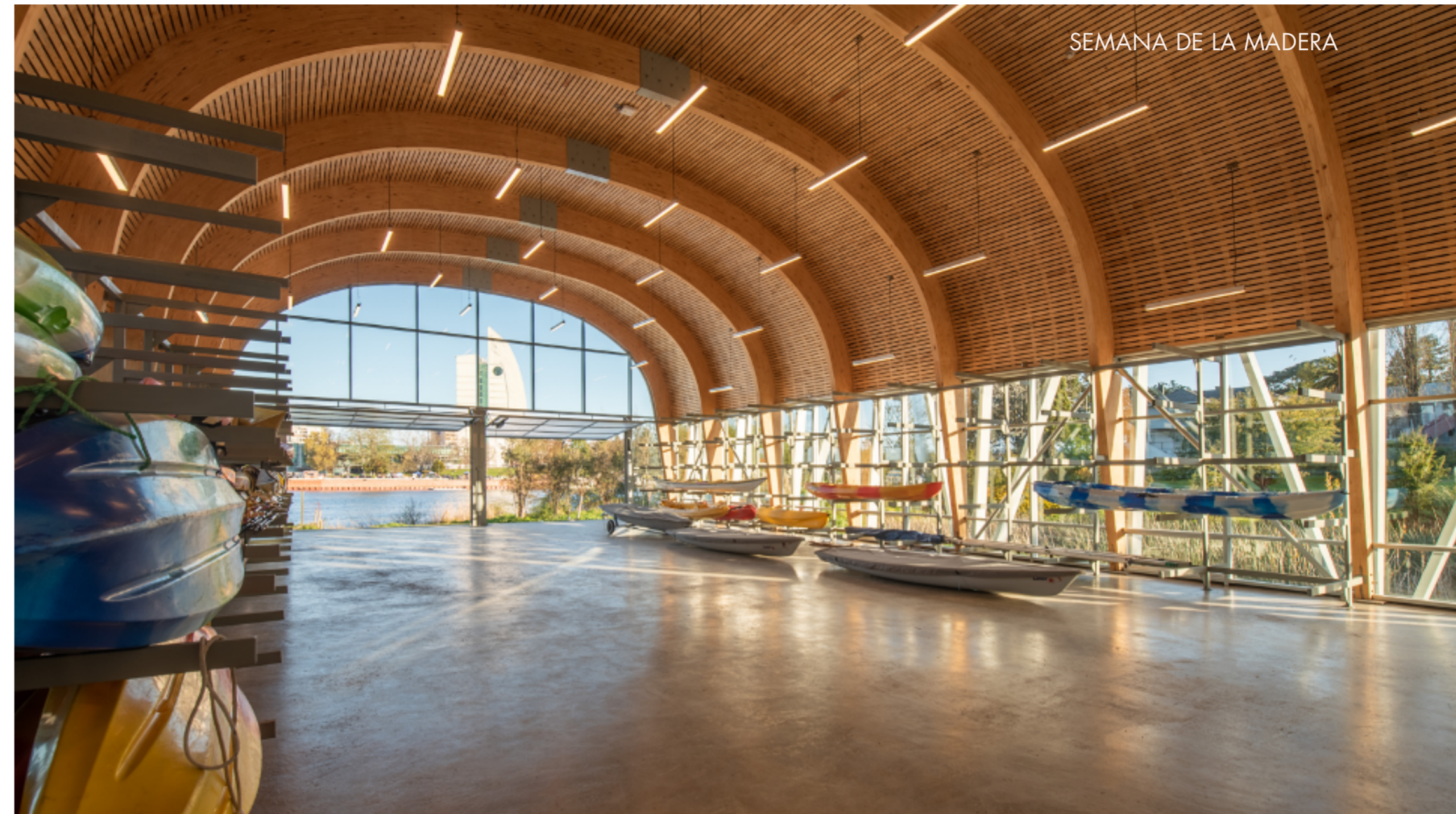
SEMANA DE LA MADERA

Las decisiones sobre la materialidad de la estructura ponen en valor la madera como recurso sustenta-ble y local. Es así como la principal estructura soportante la constituyen 17 marcos curvos de madera laminada, que, en conjunto con la cubierta curva de madera, presen-tan un objeto arquitectónico que dialoga armónicamente con su contexto, al integrar el humedal existente a la fachada norte del edificio. Paisajísticamente, se convive con este cuerpo de agua y con todas sus especies nativas ya que forman parte del acceso al edificio a través de una pasarela de 60 mts. de largo, recorrido que es utilizado y dis-frutado por la comunidad valdiviana. Es así como la propuesta, en conjunto con el edi-ficio de la Facultad de Economía, enmarca al humedal y lo vuelve un patio central donde se desarrollan zonas de esparcimiento ciudadano como reflejo de una iniciativa que vincula paisaje, arquitectura y usuarios.