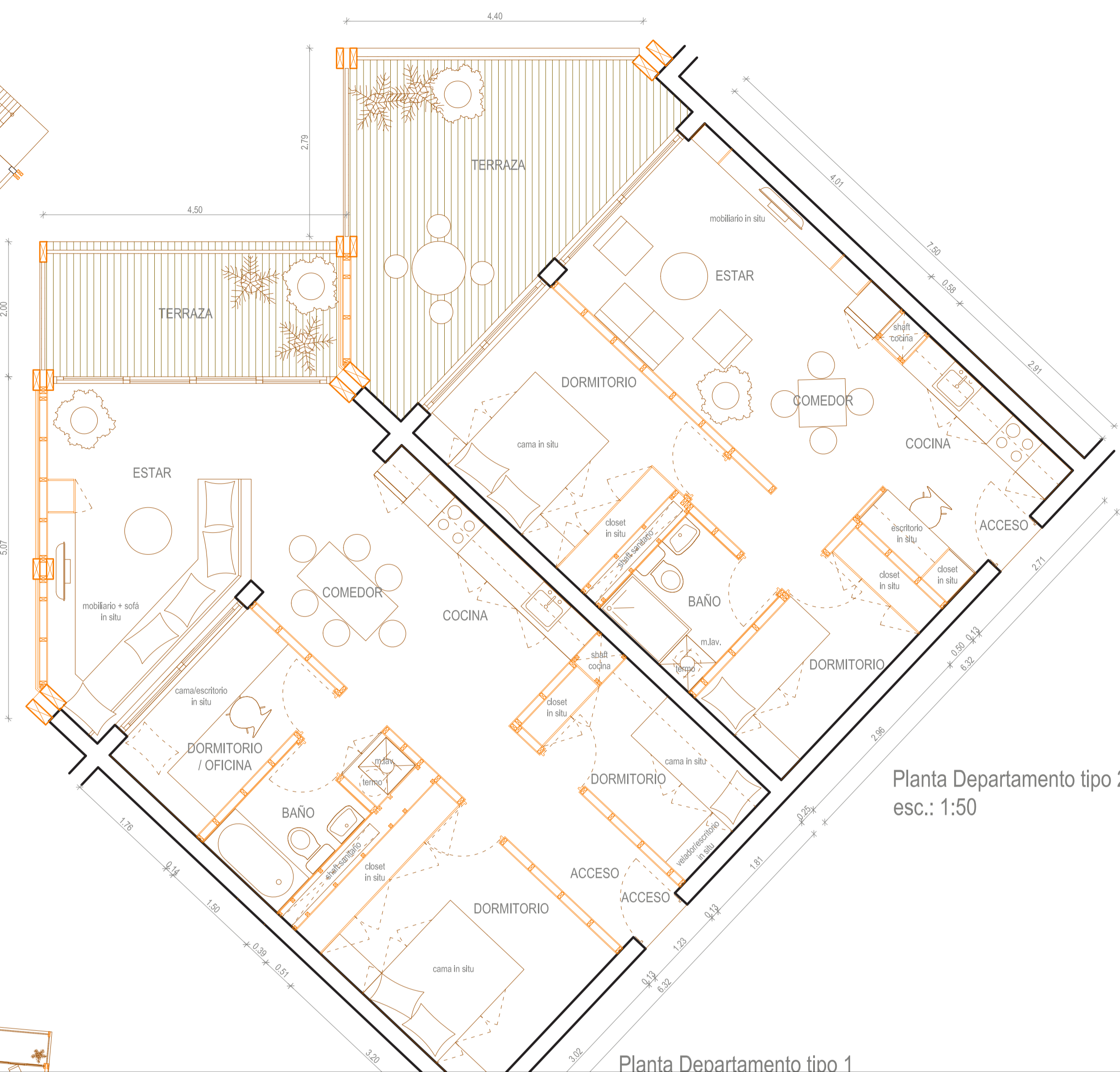
Planta Departamento tipo 2 esc.: 1:50