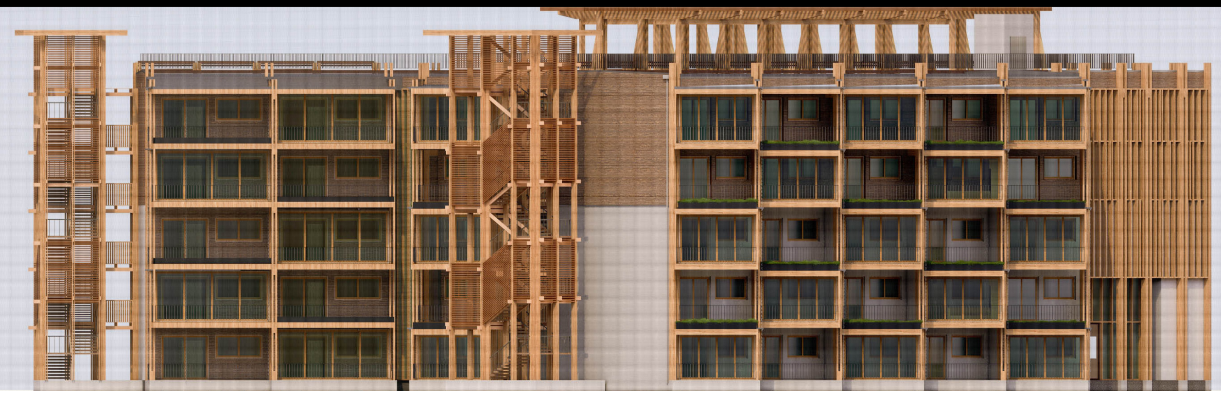
Elevación Norte esc.: 1:200