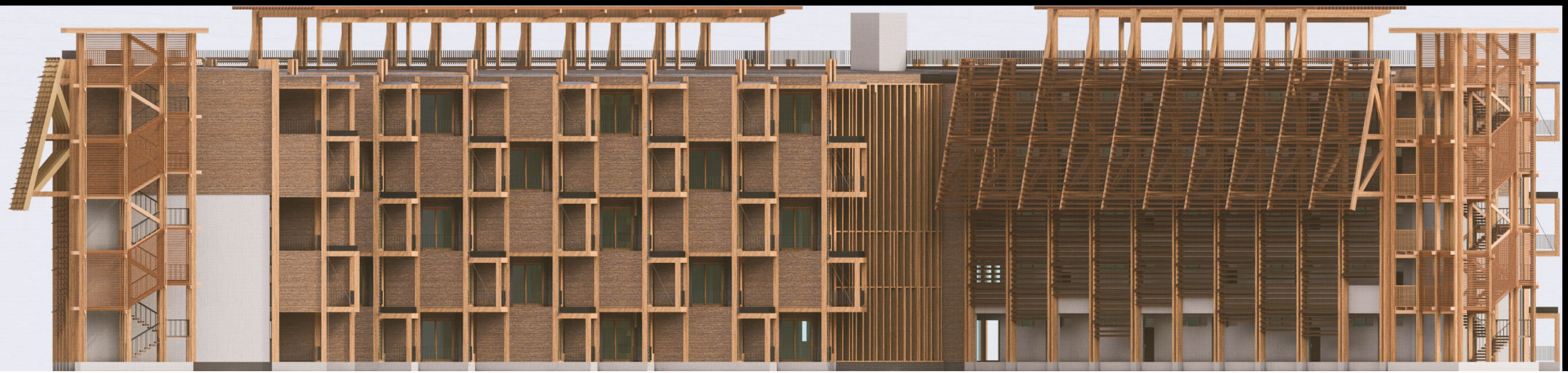
Elevación Nororiental esc.: 1:200