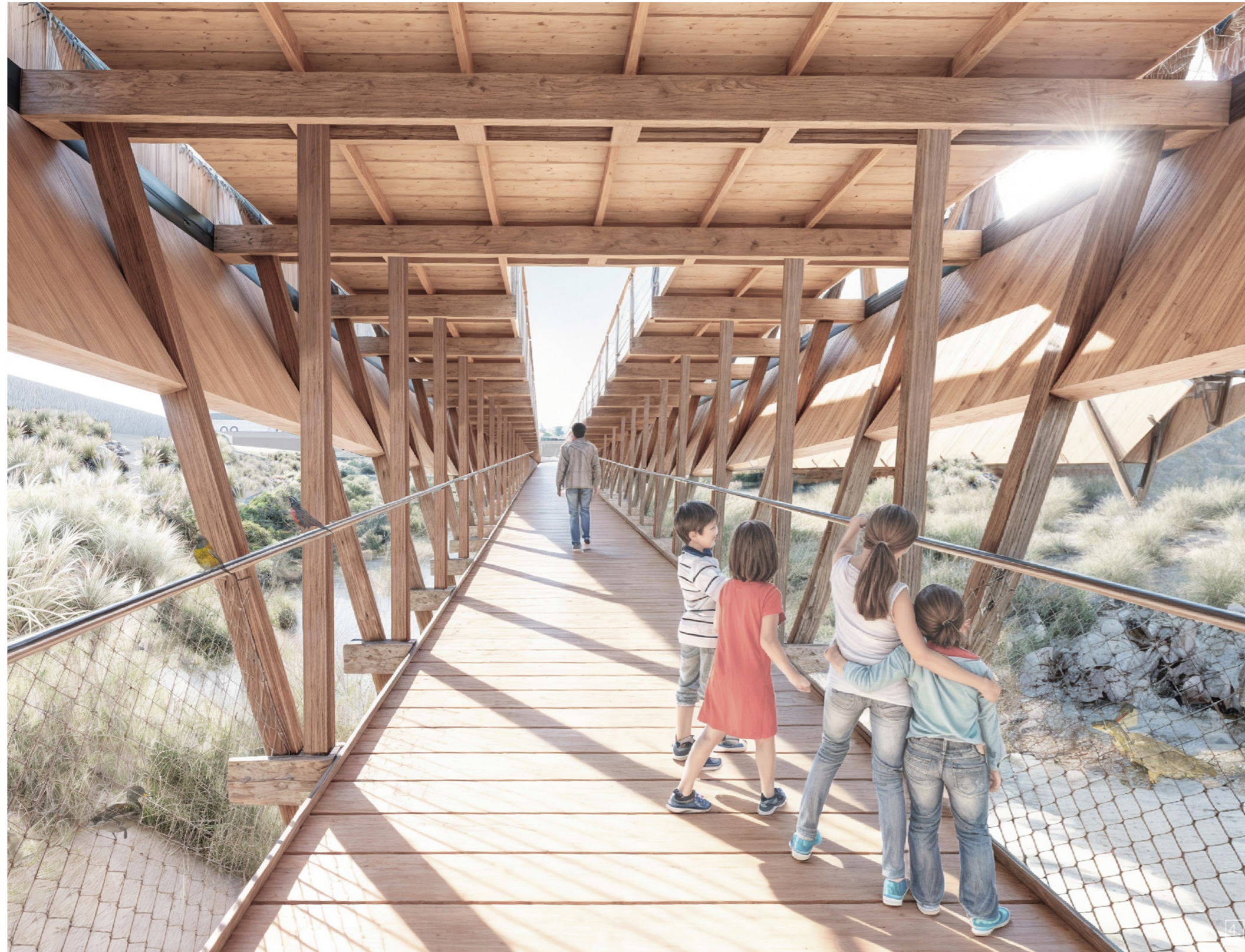
ACCESO DESDE EL TELETÓN : INTERACCIONES ÍNTIMAS CON EL RÍO LOA