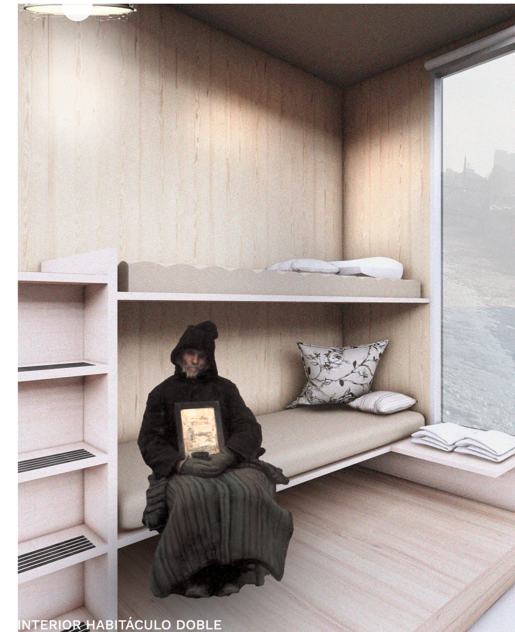
INTERIOR HABITÁCULO DOBLE