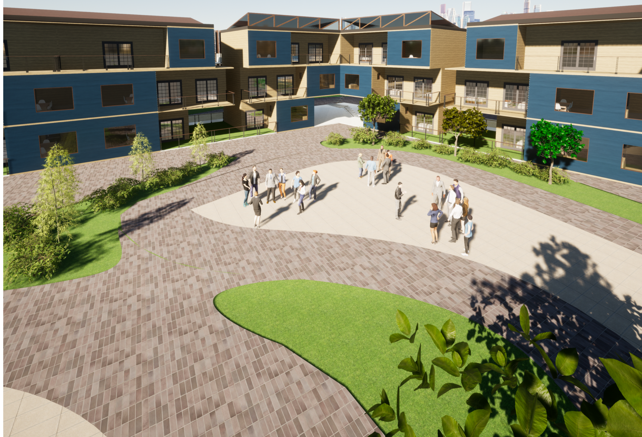
VISTA DE FACHADA NORTE