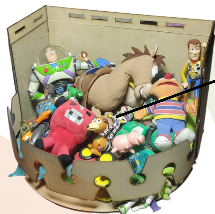
JUGUETES A LA VISTA

A través del juego, los niños aprenden a forjar vínculos con los demás, a compartir, negociar y resolver conflictos, además de contribuir a su capacidad de autoafirmación.